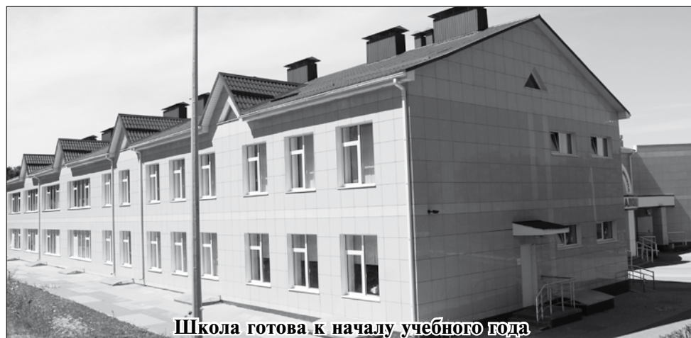
Школа готова к началу учебного года

мательно слушает пояснения специалиста и выносит свой вердикт: хорошее дело затеяли, ребята. Ведь это — новые рабочие места для наших селян. Их в селе по понятным причинам не густо.