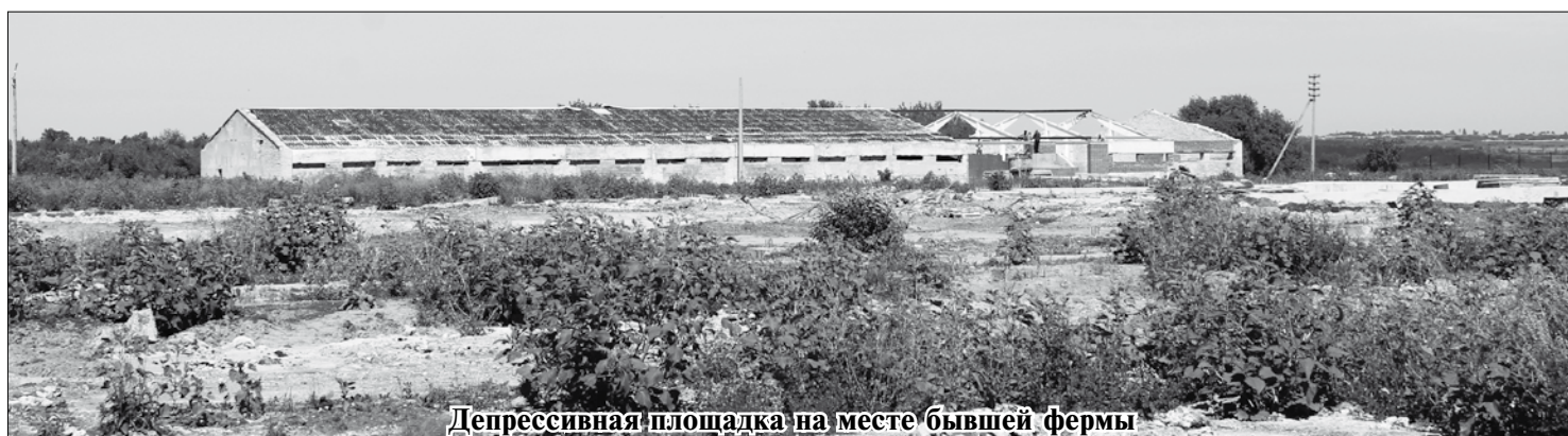
Депрессивная площадка на месте бывшей фермы