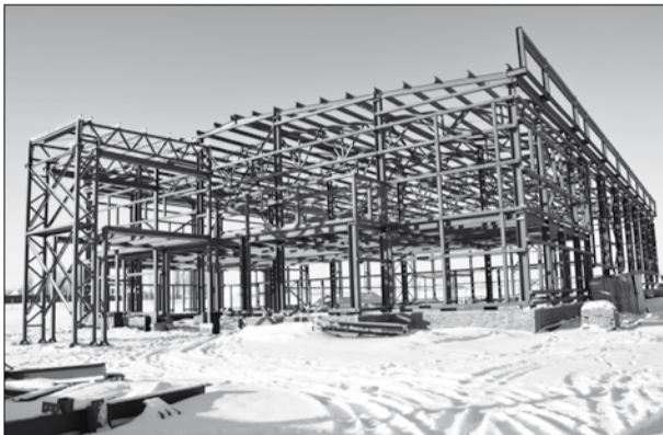
На улице Лесной строится ФОК