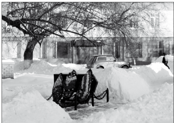
У братской могилы