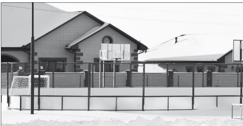
Спортивная площадка возле Северной школы № 1