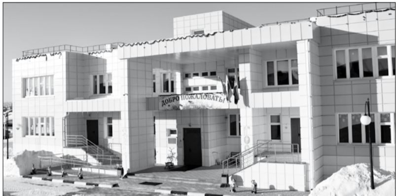
Детский сад № 22